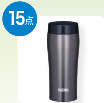
サーモス ケータイマグ