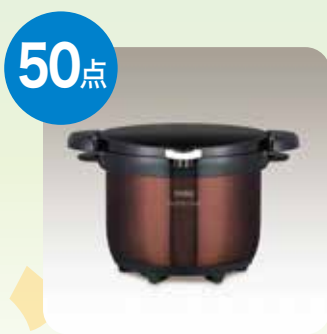
サーモス シャトルシェフ