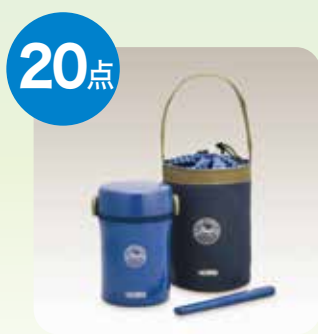
サーモス ステンレスランチジャー