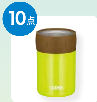
サーモス 保冷缶ホルダー