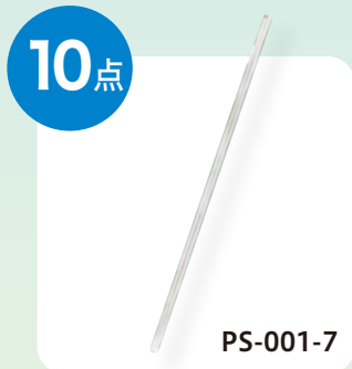
シゲミ 高性能5mm NMRサンプルチューブ