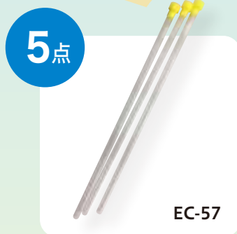
シゲミ ディスポーザブルタイプ NMRサンプルチューブ 3本