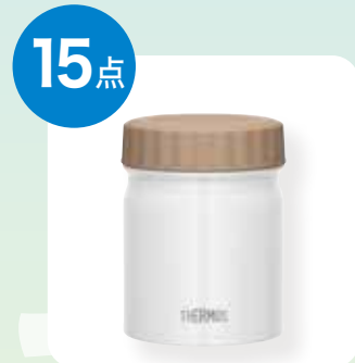
サーモス スープジャー