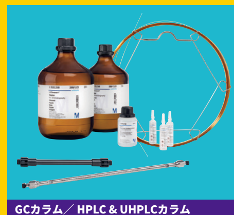
GCカラム / HPLC & UHPLCカラム