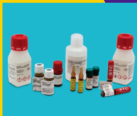
標準物質 & 認証標準物質 (CRM)